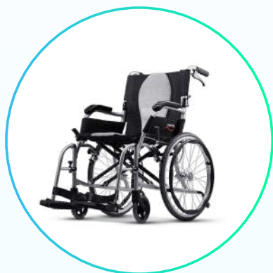
Imagen del producto

Importante: El ancho, la profundidad y la altura varían según la toma de medidas del paciente.