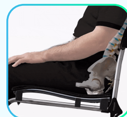
Asiento ergonómico S-ERGO patentado.