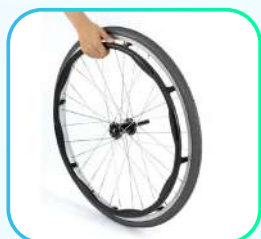
Aros impulsores ergonómicos.