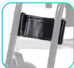
Correa de pantorrilla independiente.