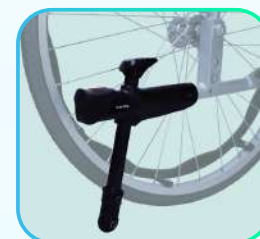
Ruedas antivuelco (opcional).