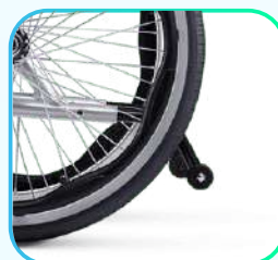
Ruedas antivuelco tradicional.