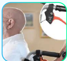
Sistema de freno de empuje y tracción.