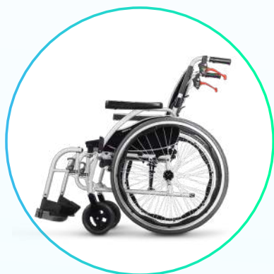
Imagen del producto

Importante: El ancho, la profundidad y la altura varían según la toma de medidas del paciente.